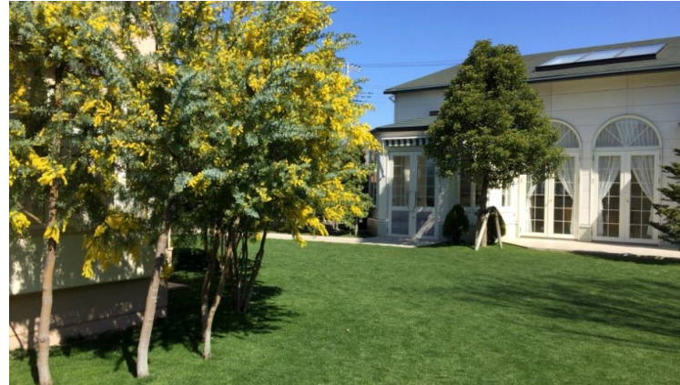
1年中緑がきれいな芝生の庭(設計、施工、樹木管理)

美しい自然豊かな魚沼地域に似合う暮らしの舞台、雪に育まれ雪と共に歩む暮らしの舞台、そんな庭造りを目指しています。