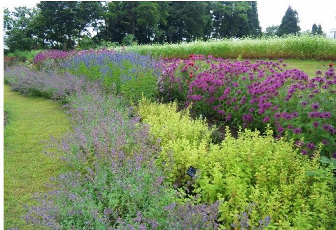
スキー場のゲレンデにハーブガーデンを整備(施工・維持管理)