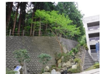
ヤマモミジの自然風剪定前(左)と剪定後(右)